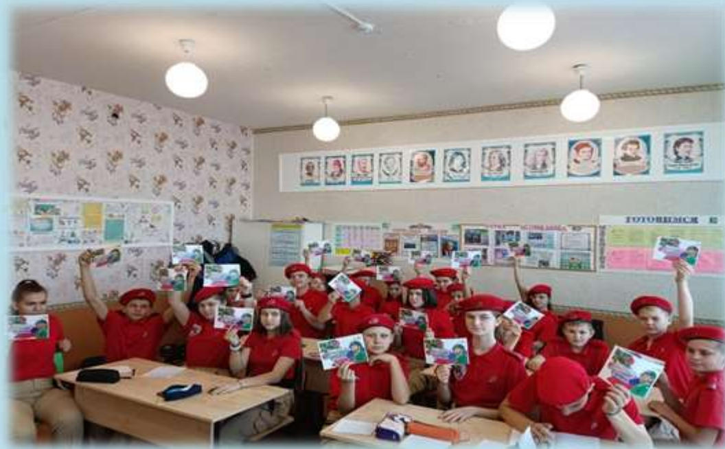
Акция «Письмо солдату»