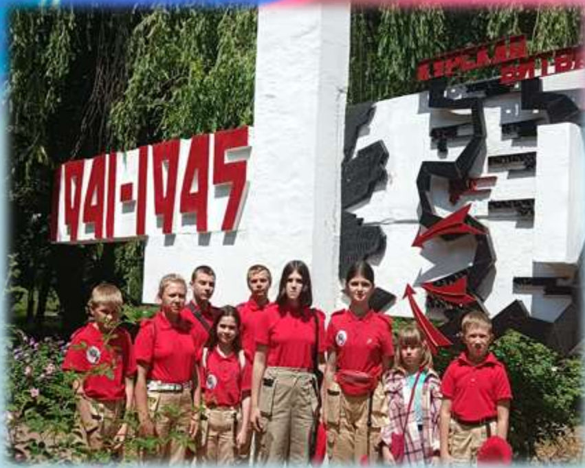
Посещение краеведческих музеев

Историческое - познание истории Отечества, места и роли России в историческом процессе, героического прошлого разных поколений, осознание неповторимости Отечества, неразрывности с ним, гордости за его историю, ответственности за происходящее в обществе и государстве.