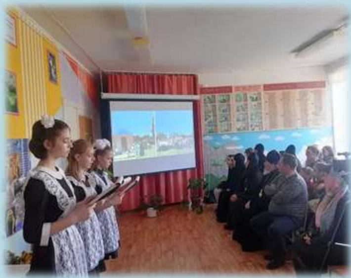
Тематические линейки, вынос флагов, прослушивание гимнов РФ

Духовно – нравственное - осознание учащимися в процессе патриотического воспитания высших ценностей, социально значимых процессов и явлений реальной жизни, способность руководствоваться ими в качестве определяющих принципов, позиций в практической деятельности.