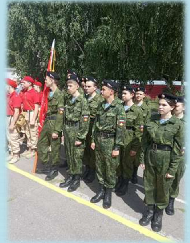
Участие в различных патриотических конкурсах