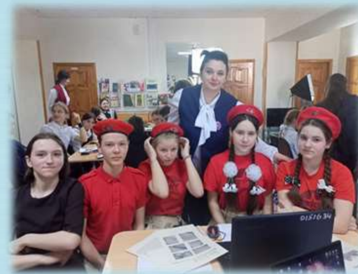
Участие в областном проекте « Я курянин»