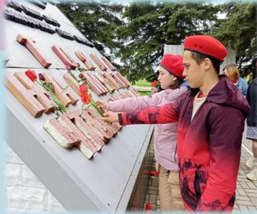
Экскурсии по боевым местам