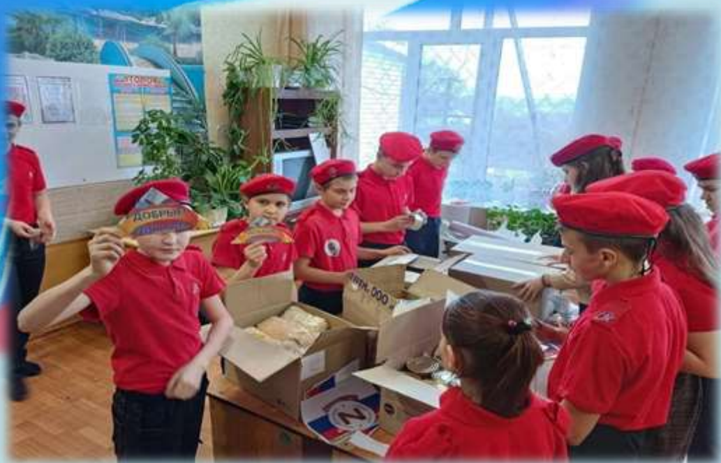
Акция «Посылка солдату»