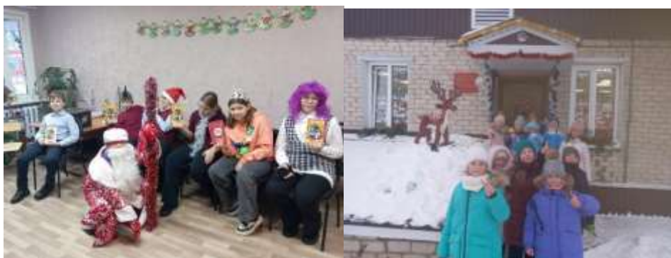
Экскурсия в ТЮЗ!

https://vk.com/public217630762?w=wall-217630762_220