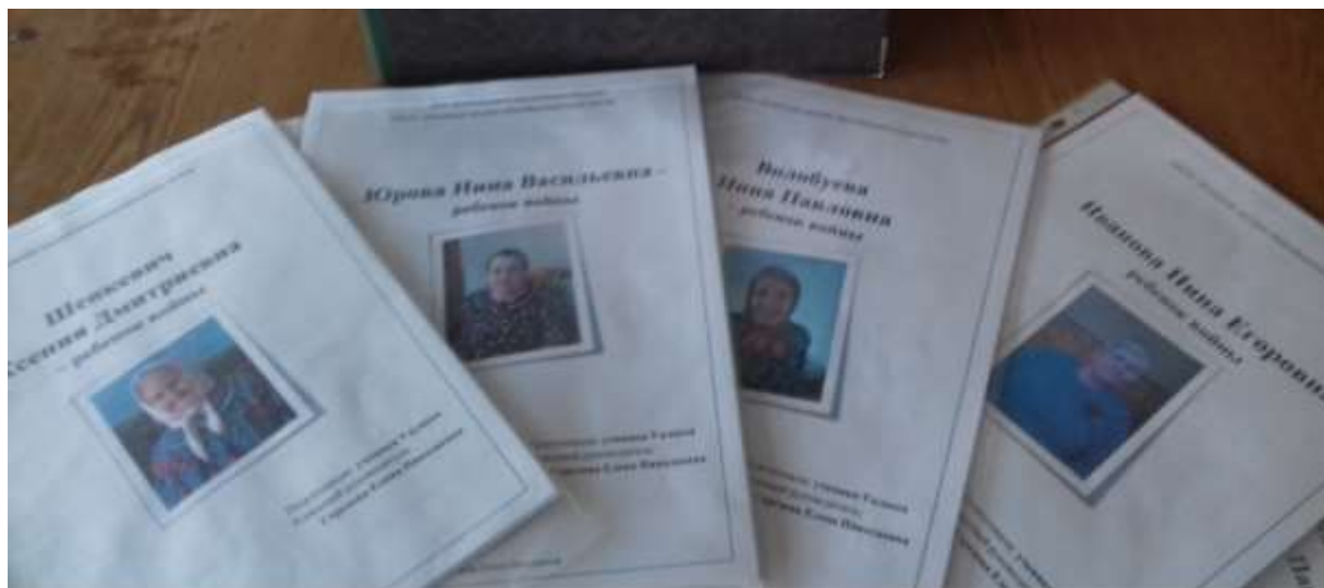
Альбом «78 лет Победы» с дисками видеозаписей и воспоминаниями и о войне тружеников тыла, узников войны – односельчан.