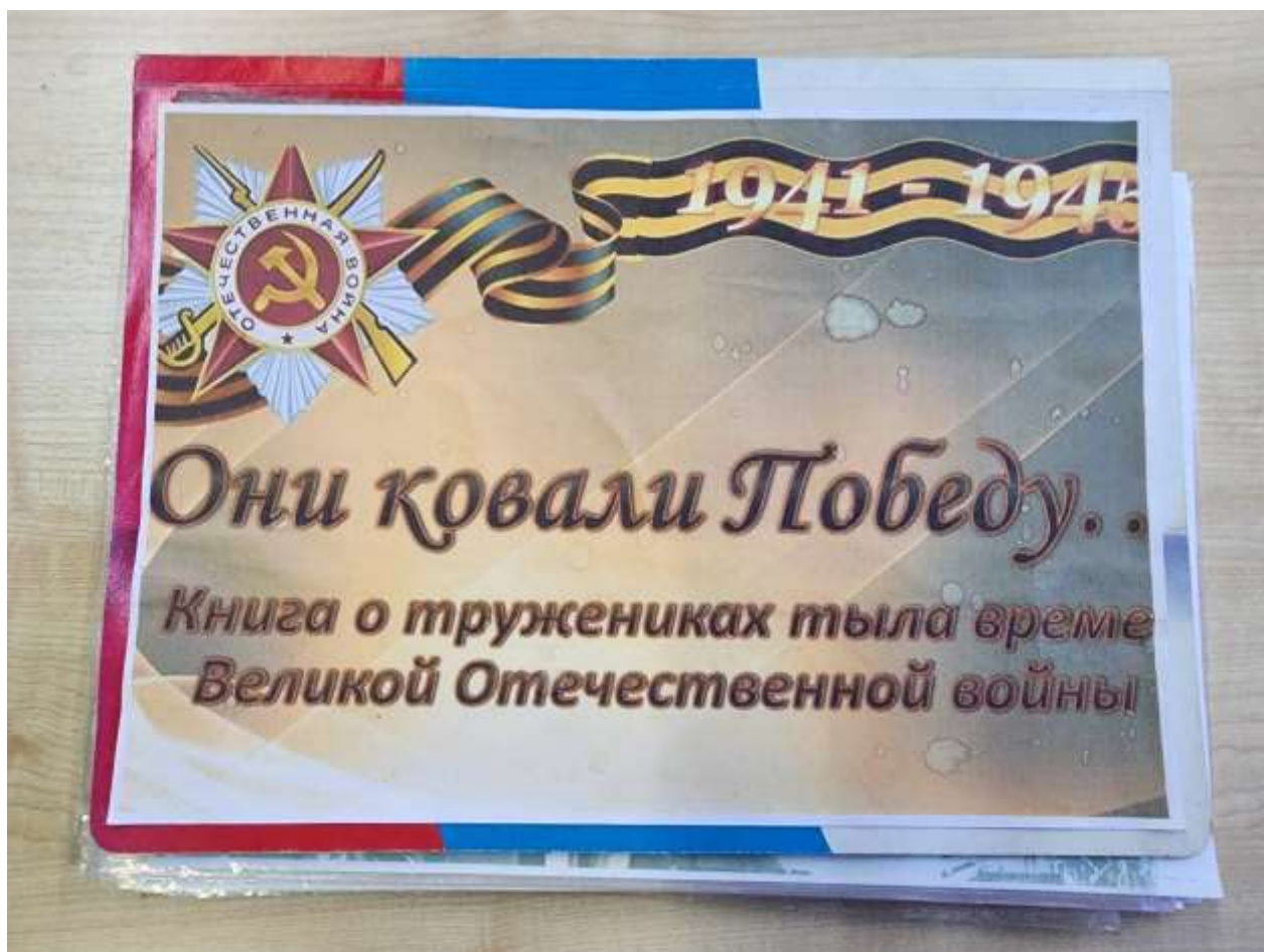
Альбом «Они ковали Победу» с фотографиями тружеников тыла.