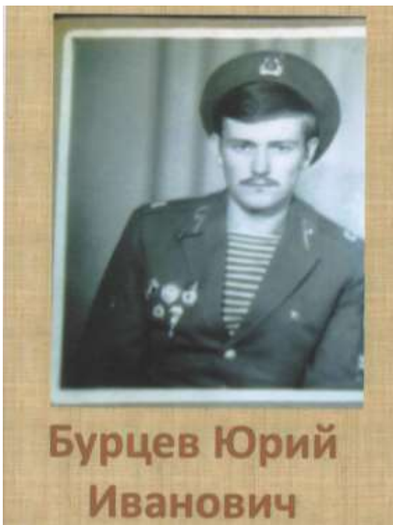
Мой дедушка - афганец