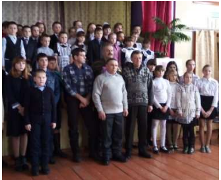
Мой дедушка на мероприятии, посвящённом 30-летию вывода советских войск из Афганистана в Фентисовском СДК